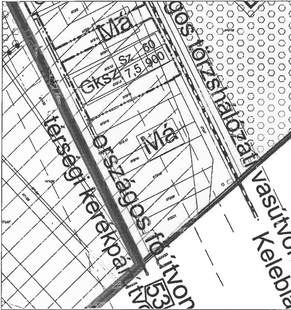
Védőerdőbe átsorolandó 074/15 „b” alrészlet a szabályozási terven (alul közepén)